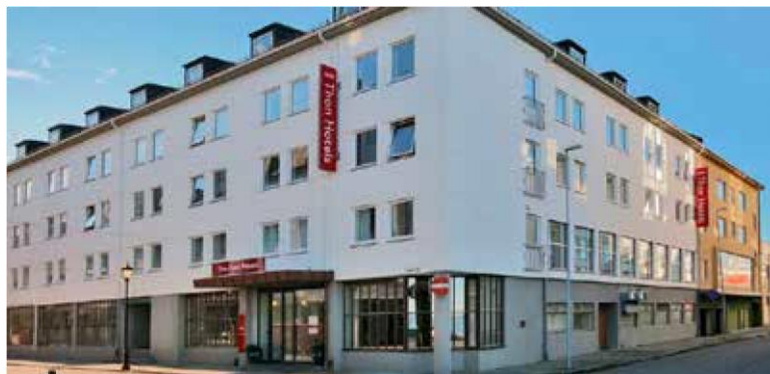
Thon Hotel Ålesund

gjennom avtalen med Norges Svømmeforbund