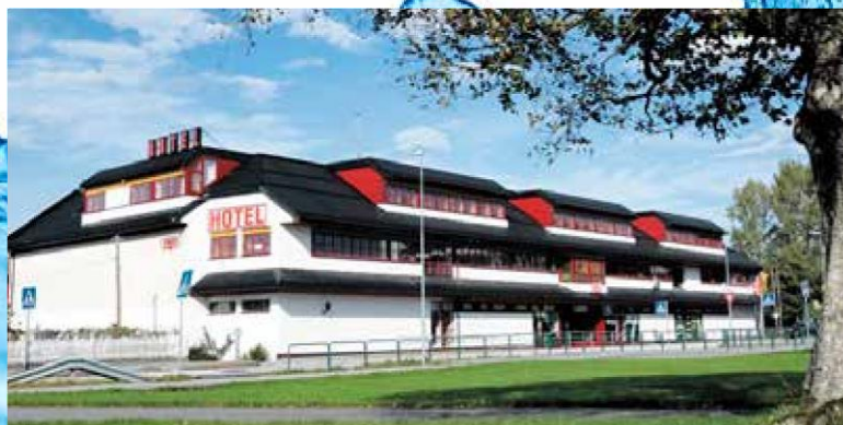
Thon Hotel Baronen