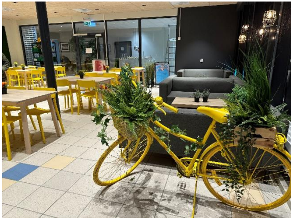
Hovedkafe, inngang A – Bodø Spektrum.

TUR kafè er en del av Bodø Bakeri og er Bodø svømmeklubb sin samarbeidspartner på servering under NM Svømming 2024. Vi er etablert i Bodø spektrum med to utsalgssteder. Sammen med Bodø Svømmeklubb skal vi sørge for at dere får i dere god mat til lunsj under arrangementet.